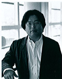
講師 いがらし たらう 五十嵐 太郎

2008年のヴェネツィアビエンナーレ国際建築展では日本館コミッショナー、またあいちトリエンナーレ2013芸術監督を務めるなど、国際的にその活動が注目されている。専門の建築史の他にも、映画やマンガ、アニメ、ゲームといった、建築とは直接関係しない分野も含めた幅広い知識を保有している。著書に「美しい都市・醜い都市現代景観論」、「現代建築に関する16章空間、時間、そして世界」「被災地を歩きながら考えたこと」他