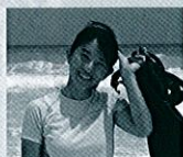
ふるや ちかこ 古谷 千佳子 写真家

沖縄の建築様式をいかしたデザインで都市部における快適な生活空間づくりを実践している。2007年には「東京町家・町角の家」で、経済産業大臣賞を受賞。現在はi-works project(住まいの標準化)を推進するなど、幅広く活動中。著書に「子供たちに伝えたい住まいの話「オキナワの家」」「伊礼智の住宅設計」、他